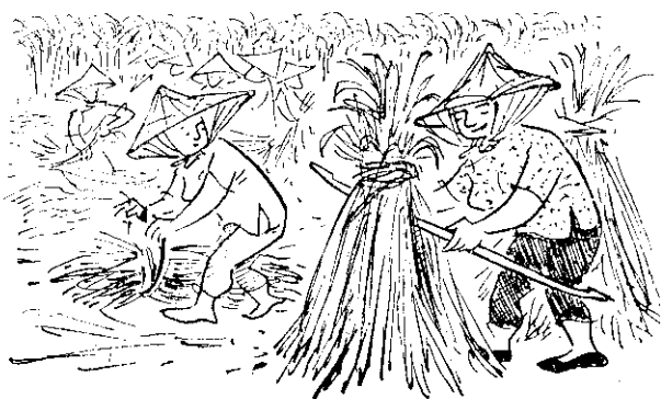
了去廢料燃作者料材的肥堆似以可多許