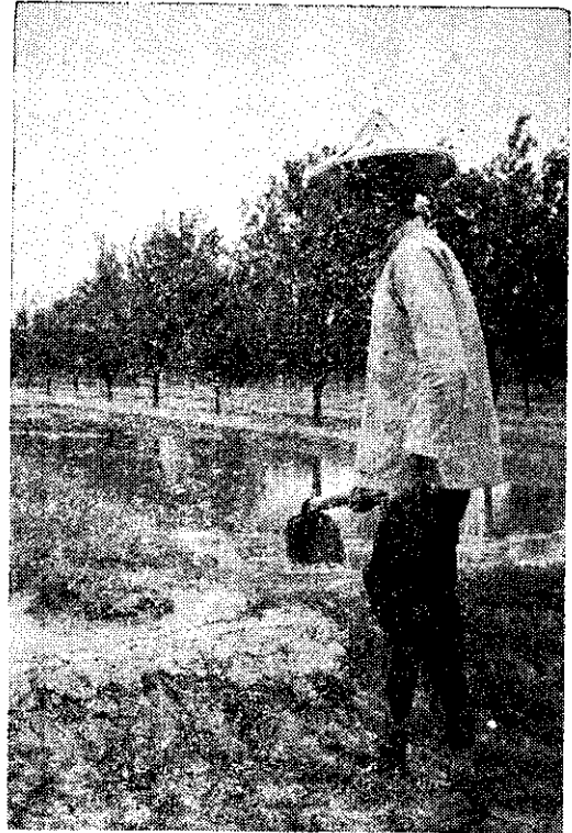
灌月每應，園桔柑的開月四三