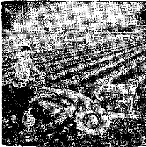
野馬牌富士號萬能耕耘機