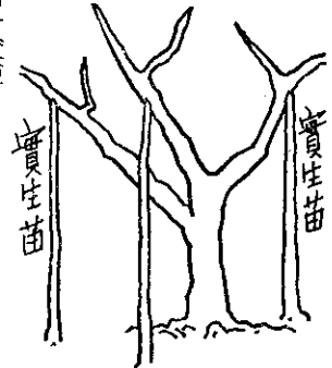
實生枝實生苗：二圖