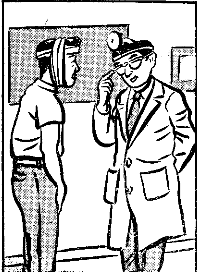
，伊告習醫 ，除要着記要着千 。耳撫莫萬千