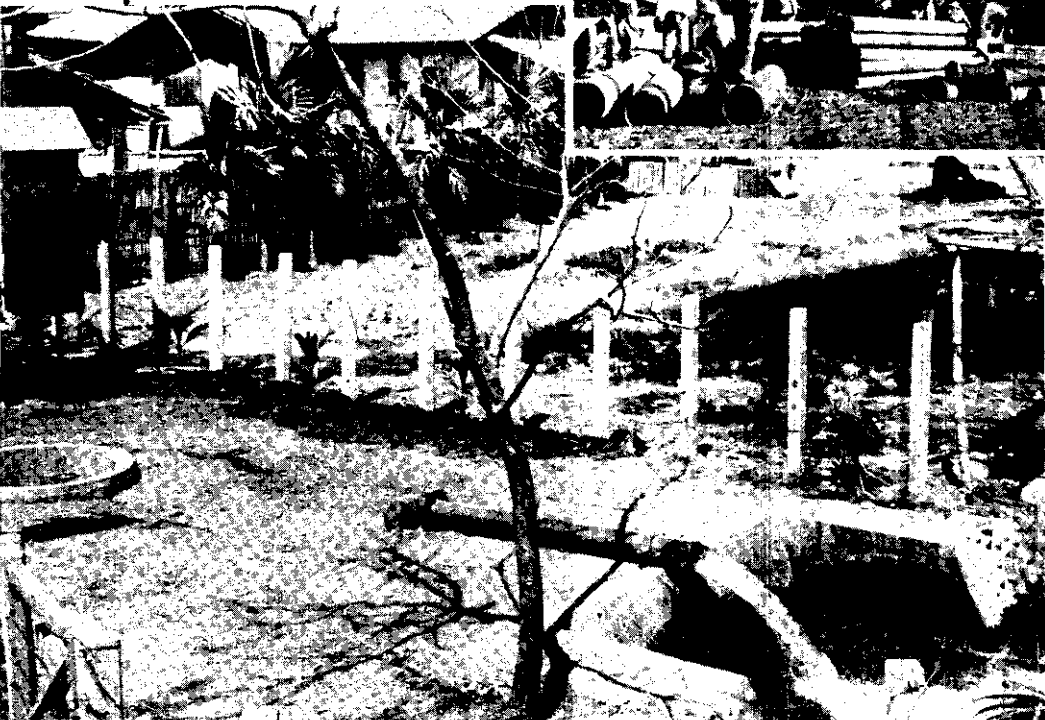
← 已完工之水井，供水農家。