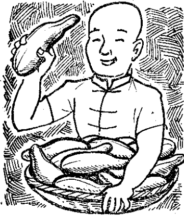
瓜越的培栽料肥化用

人糞尿的施用量及施用方法，是根據農家的習慣，合一公頃一萬四千公斤，分作十次施用。前三次澆水六倍，以後三次澆水三倍，最後四次