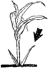
土壤愈肥，分蘖(箭頭所指者)愈多。

除以上所說的幾種害蟲之外，還有大蟋蟀、螻蛄、浮塵子類及葉蟲類，為害大豆幼苗。大蟋蟀在本省早田發生普遍，白天潛伏在地下的巢孔中，夜間出來為害，切斷豆株，搬入孔中。要防治大蟋蟀，最好在播種前撒佈毒餌。毒餌製法：用米糠(也可用甘藷簽或各種蔬菜代替)一公斤，加「嚇必達可樂」(Heptachlor 二五