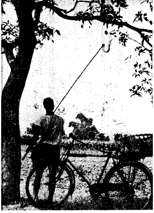
林義嘉中義的埔埔採果道樹。(攝和稿呂)

確係開墾，請先向地政機關申請，經地政機關核准後，方可開墾。在山地有不得已焚火取暖、煮飯、或掃墓焚香燒紙時，應該萬分小心，俟餘燼確實熄滅後，始可離去。五、不可在林地內任意打獵。六、發現森林火災，請速通知附近山林工作站或警察派出所。 按照森林法第五十一條規定：放火燒燬他人的森林，是要處三年以上十年以下的有期徒刑，不小心燒毀他人的森林，也要處二年以下的有期徒刑。除了請農友確實注意，防止森林火災外，並勸告你的隣人，共同保護森林。