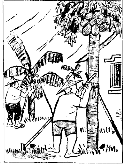
，喬喬軟瓜木 ，了倒吹若瓜木 ，笑見兼錢了無若