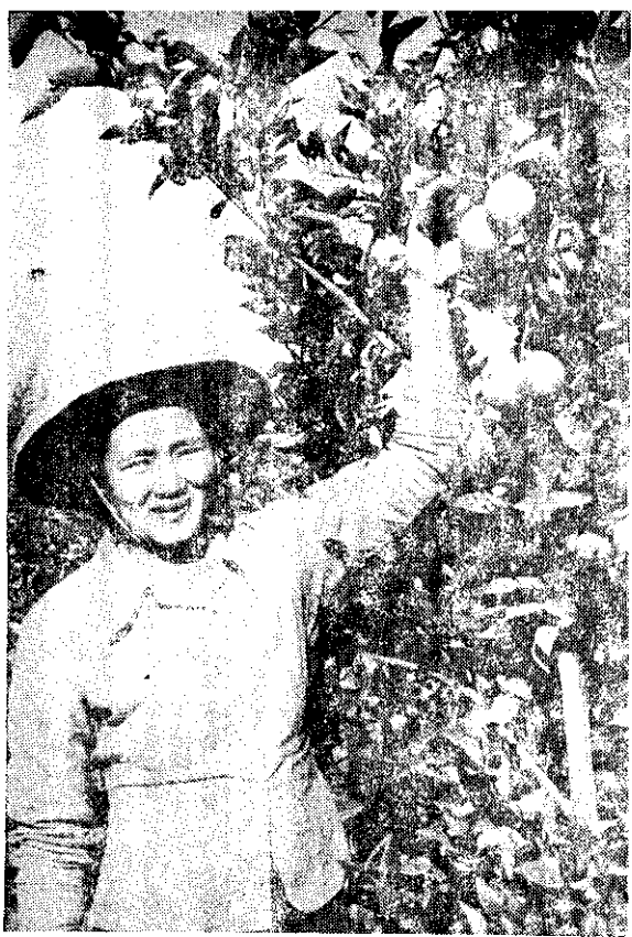
晚命西亞橙結實累累