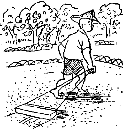
使用新式二，四—D殺草

二，四—D是常用的一種殺草劑，它可以殺死大部份的闊葉雜草，可是在果園內或果園附近應用時，常因藥劑（或藥粉）漂飛而損傷果樹；因為二，四—D對果樹也會發生毒害的。以出產柑桔出名的美國加里福尼亞州，還因此訂定法律禁止使用二，四—D殺草。