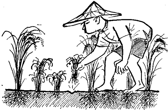
。取拔易容很，良不育發部根，株稻的害為病萎黃受

(2) 除去田間雜草：稻谷收穫後，浮塵子都飛往稻田附近的雜草叢中潛伏，所以應清除田間的雜草，驅除越冬的浮塵子。