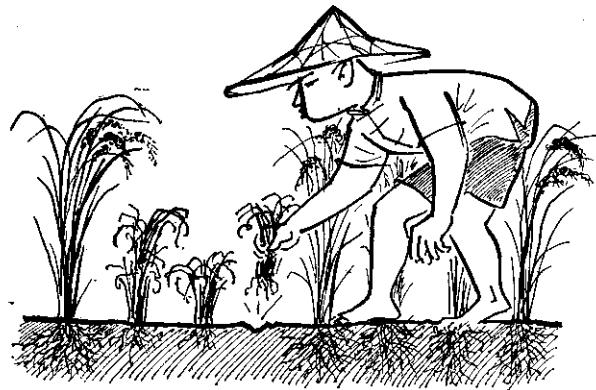
。取拔易容很，良不育發部根，株稻的害為病萎黃受

(2) 除去田間雜草：稻谷收穫後，浮塵子都飛往稻田附近的雜草叢中潛伏，所以應清除田間的雜草，驅除越冬的浮塵子。