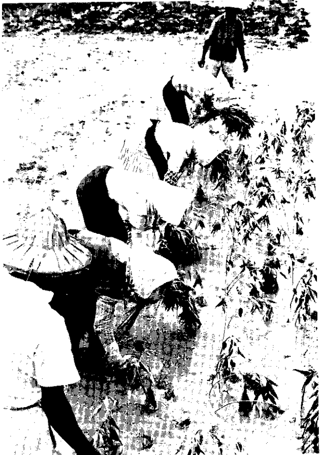
△ 蔴黃植種於忙農蔴南臺

民農帶一南台，節季植種蔴黃省本係月四年每 公百四千五萬一有共積面蔴植，度年本。碌忙為極 ，外用使省本供足除，噸萬兩蔴黃產生可計預，頃 。本日銷外份部一以可尙