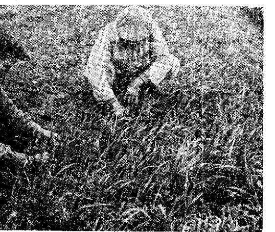
麥燕—草牧季冬種一的培栽部北灣臺台適

二十斤土壤的比例，拌和後播在田中。在播種前最好每公頃施下過磷酸鈣或熔磷二百至三百公斤，氯化鉀一百公斤作為基肥。假如土壤過份瘠薄並且是初次種植紫雲英時，可另加硫酸銨或氯化鈣五十至一百公斤。酸性過強的土地，最好每公頃施用石灰石粉二千至三千公斤。在生長期間如土壤過乾，最好能灌溉一、二次。