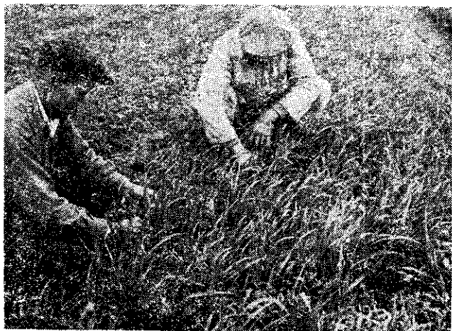
麥燕—草牧季冬種一的培栽部北灣臺台適

二十斤土壤的比例，拌和後播在田中。在播種前最好每公頃施下過磷酸鈣或熔磷二百至三百公斤，氯化鉀一百公斤作為基肥。假如土壤過份瘠薄並且是初次種植紫雲英時，可另加硫酸銨或氯化鈣五十至一百公斤。酸性過強的土地，最好每公頃施用石灰石粉二千至三千公斤。在生長期間如土壤過乾，最好能灌溉一、二次。生長良好時，下種後一百天左右，便可開始刈割。因為紫雲英所含營養份豐富，豬、雞、牛、羊全可餵飼，每公頃生草量通常有二萬五千公斤左右，在本省的記錄，最高產量曾達六萬九千公斤之多。家畜