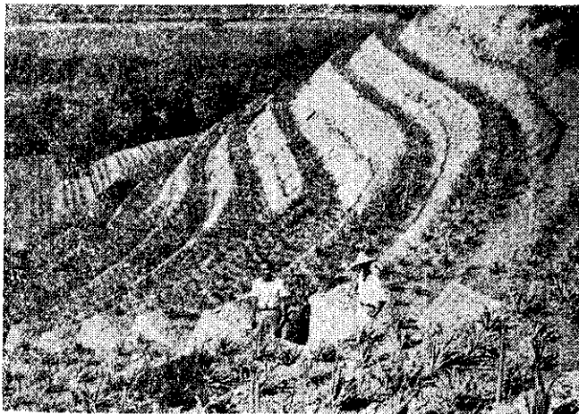
水土保持保證年年豐收