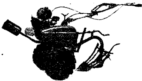
(地霸王牌耕耘機犁耕圖)