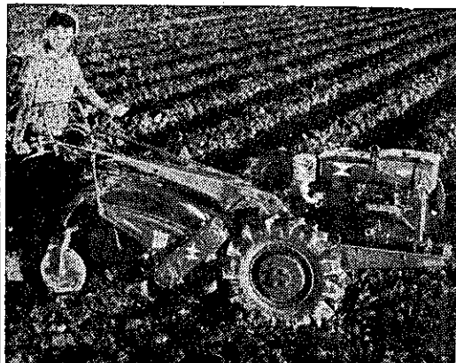
野馬牌富士號萬能耕耘機