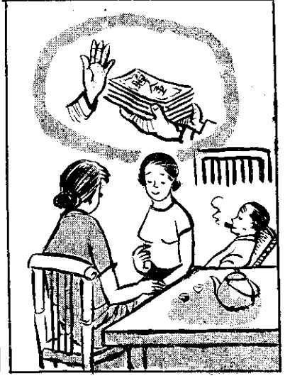
雙女聘，方後除家，意告原約，愛父在勿，知母，亂。