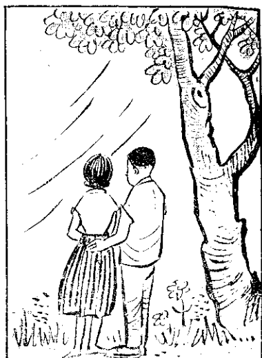
，界世的明文在現 ，愛德講由自女男 ，該應是嫁當大女