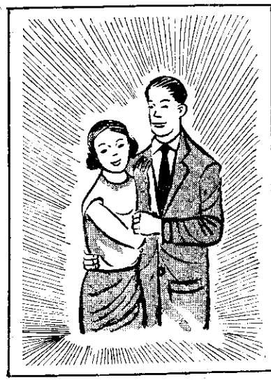
原男大，神聖，情愛，明。