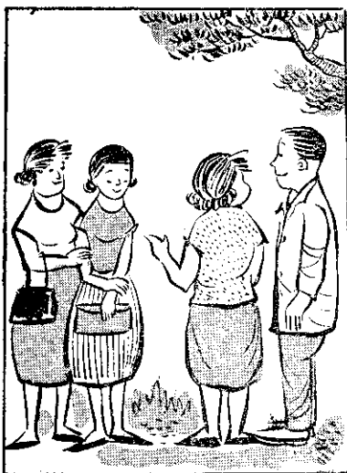
，事大的生一(妻夫)某胚 ，住不靠兩一見相 ，久有那合結情無