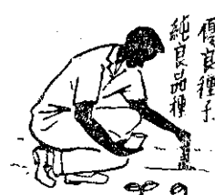
二圖：接蠟塗抹法接個一子