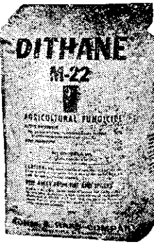
性濕可二十二生大 裝原國美磅三劑粉

被害以葉片，豆莢及種子較為顯著。患部後期均為紫褐色，是名紫斑病。葉部病斑多呈不規則多角形，一枚葉片小形病斑可多達二百餘塊。罹病葉上病斑多為大形，其或多數病斑相接合，使葉片早枯死。種子被侵害時，種皮上形成紫紅色病斑，極為明顯。部分病斑由暗部向外擴展。多數種子因與外面包裹之罹病豆莢接觸傳染。本病嚴重時種皮表面全部呈紫褐色。受侵害較早者種皮常發生橫走龜裂現象。