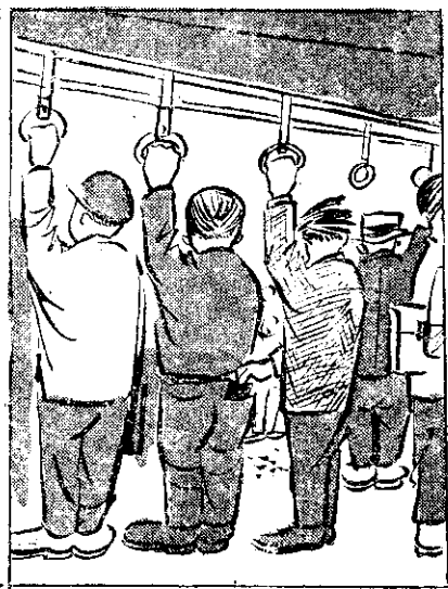
，誠不良甚偷場市站車 ，財錢入內車汽場是部 。(所場)在所的動活是部