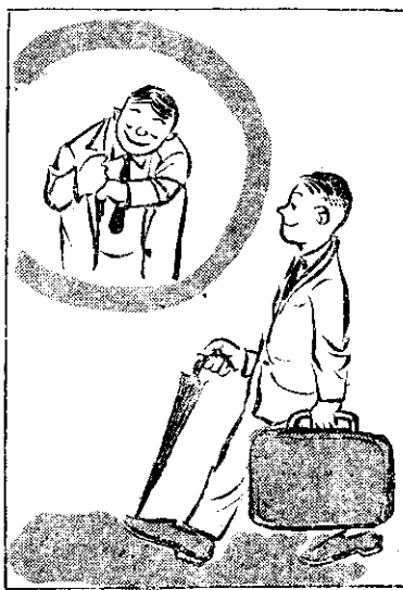
，細注着外器金注錢有 ，多帶(要不)而量盡(錦金)下意 。(你偷)捉你加法無鈕剪