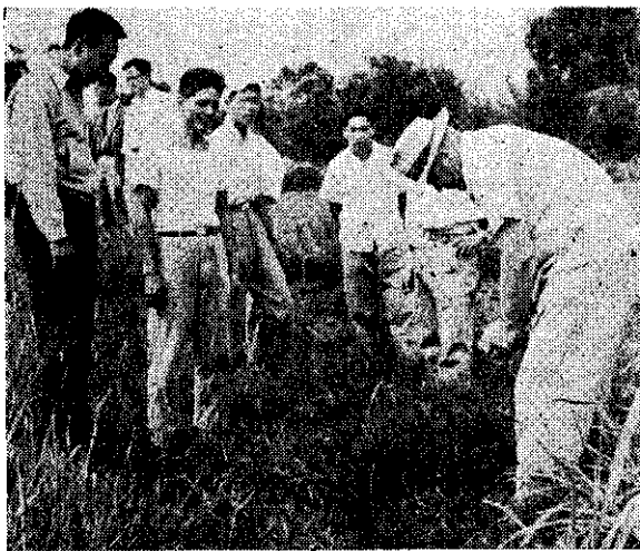
地草葛攀的鎮梅楊察視(左最)輝增陸與(右最)華臺呂會復農

在生長旺期，每次青刈或放牧後，過三星期便可完全恢復原有高度。如生長速度較此為慢，則