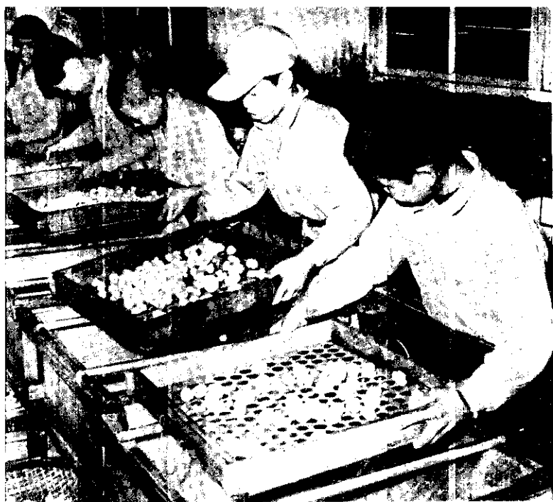
。級分小大依前罐製菇洋