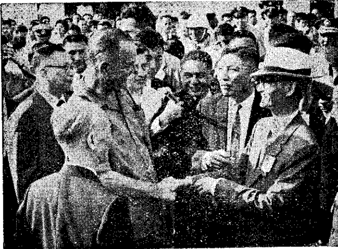
美國副總統詹森在蔣總統官邸與蔣總統握手暢談。