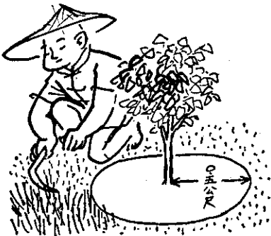
幼木茶園只宜局部除草

每年雨季後，必須巡視茶園階段及溝道有否損害。如有損害，必須及時修復。每逢雨後，必須注意茶樹週圍的積水情形，如有積水，應迅速即排去，因為幼木茶樹遭遇水浸過久，容易發生根腐病；輕則萎黃，重則枯死。