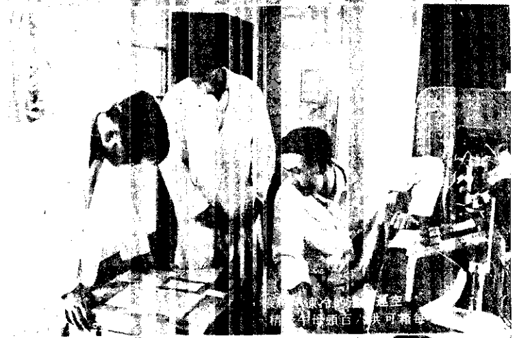
精液母頭百 狀可精每