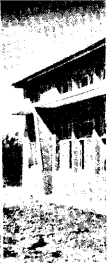
獸醫從工作站出發，到農家實行人工授精。