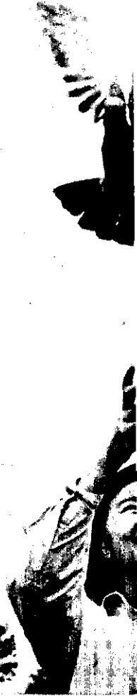
利用鴿子傳送精液，既迅速又經濟。

越南家政工作者數人，在美援機構協助下，於上月間來台訪問，參觀我國農村中家庭改善工作進步情形，作為回國