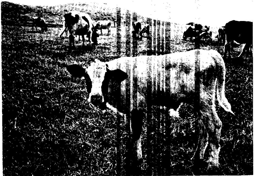
這隻小牛是由人工授精方法受孕產生的。

優良種公牛的冷凍精液，經常由美國及菲律賓空運來台，使改良牛種的目的，得以迅速收效。