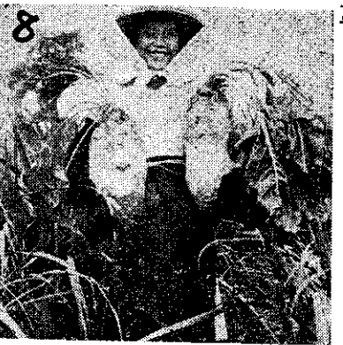
甲 甜 菜 乙 樹 薯 丙 榨 菜 丁 球 莖 甘 藍

人工授精，是改良家畜品種最有效的方法，屏東縣政府最近舉辦的家畜人工授精產犢競賽大會，是該縣幾年來實行牛的人工授精成果的總表現，從大會的空前盛況看來，這種新技術的推行，已經得到農友們的熱烈贊助了。