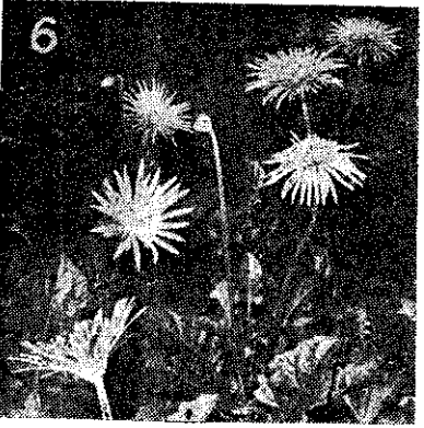
甲一 除 蟲 菊 乙一 蒲 公 英 丙一 非 州 菊 丁一 大 羅 菊