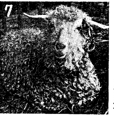
甲 安 哥 拉 山 羊 乙 澳 州 綿 羊 丙 紐 平 乳 羊 丁 阿 爾 拜 乳 羊