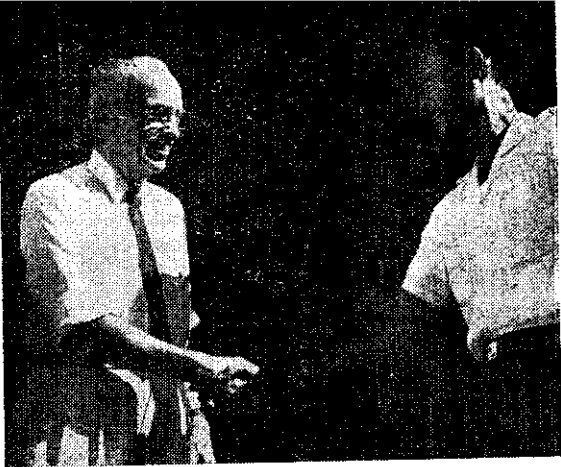
敬致（左）生先德亨向扶宗陳員導指會健四鄉井龍

當記者問他對中國有無臨別贈言時，他說：『中國還是一個農業國家，政府必須經常把農民的利益放在心上。』（司棋）