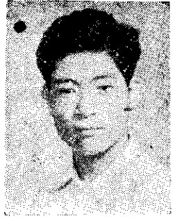
友 農 郎 政 陳

民國四十六年，一月十六日，我開始訂「豐年」，自第七卷第二期起連訂了二年，至第九卷第一期止。這二年中自己覺得並沒有得到什麼益處，只是欣賞漫畫連載，如「海螺緣」「荒島奇夢」等。每期都是如此，覺得沒有趣味，所以從九卷二期起，就沒有再續訂了。