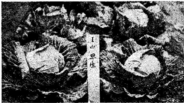
藍甘「生早中四坂」的銷外合適

因甘藍適於富有有機質的中性或微酸性壤土栽培，而在都市近郊栽培大部分施用肥料，且前作水稻也常用水肥，土壤酸性較強，所以，須每十公畝施一百二十至一百八十公斤的石灰以中和酸性。