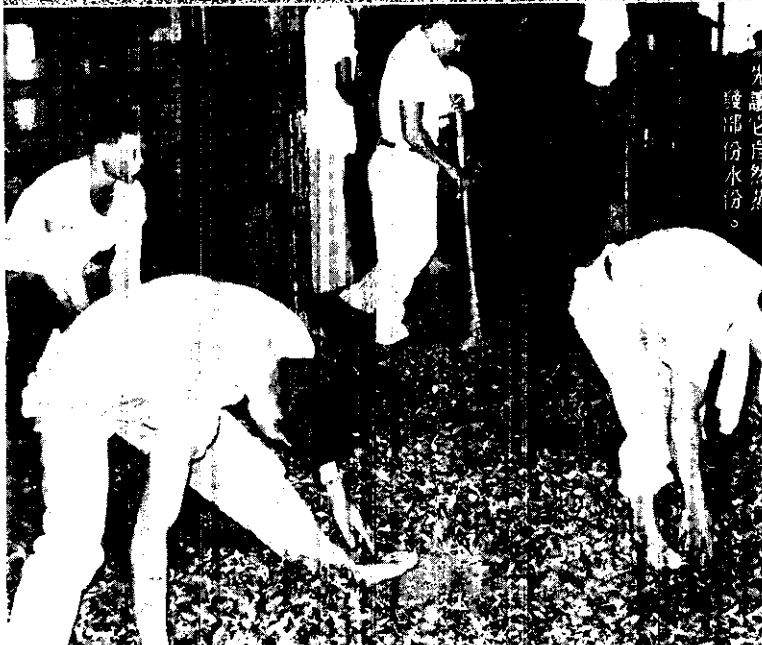
九龍七自然茶 發部份水份。

全省首次綠茶製造技術比賽，於上（九）月在桃園縣龍潭鄉高原製茶工場舉行，參加者共五組三十人，桃園縣組榮獲冠軍。台灣綠茶輸出量，僅次於紅茶，年輸出約一千萬磅。由於有關機構的倡導，年來茶菁增產頗見成效；目前致力於茶葉製造技術的改進，以爭取國際市場。