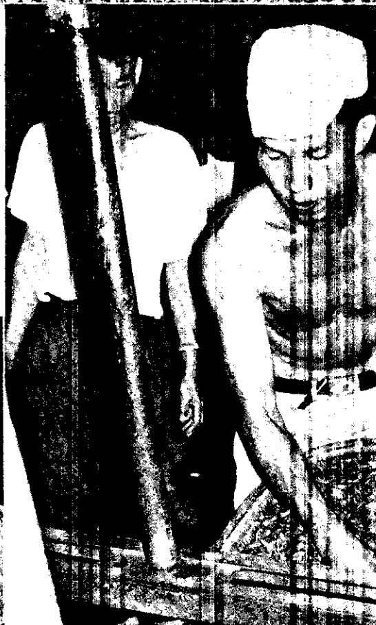
。械機用改已現，程過的搓揉脚用去過