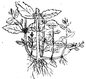
部根的「號一交同」種品新荷薄

徒長，葉部發育失常，含油量減少。雨後或颶風後立即收穫，也將減低含油量。再者，薄荷葉的含油率，以稚葉為最高，葉子老熟，含油率也隨着減低，所以，過遲收穫時油量較少。至於北風降低含油量，南風提高含油量一節，農試所迄未發現例證，並不可靠。