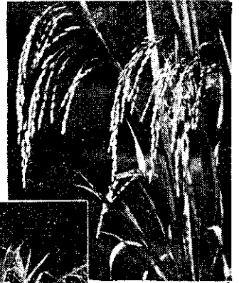
↑「臺中在來一號」稻穗在劍葉下面，是該品種特徵。 ←盆栽試驗中的「臺中在來一號」，稻株矮，分蘗多。