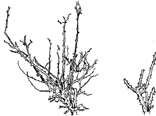
後剪修(右) 前剪修(左): 剪重

修剪薔薇花，在幼株及大株的剪法是不一樣的。幼株的薔薇花，因為栽種不久，樹勢不旺，往往不使它開花，而着重在養成骨幹，培育樹勢。所以修剪較少，及剪掉過細的弱枝就行了。大株修剪需要耐心，對於已經開花多年的大株。修剪較重也較煩，需要細心和耐心。首先要剪掉全株的枯枝、病枝、有蟲枝及過細的枝條，這樣可使樹冠內部空曠，餘下的枝條發育良好。而且輪廓清楚，對於修剪、噴藥、採花等均較方便。其次要剪掉花株上不適當的枝條，如交叉的、重複的、過密的枝條；向樹冠內部生長的枝條，也