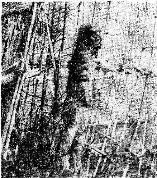
流水放狗死，頭樹吊貓死。！留可不萬千，慣習惡種這。

農忙工作，體力最重，要多用肥皂洗手，洗澡和洗衣物，是保持健康最便宜而最有效的方法。