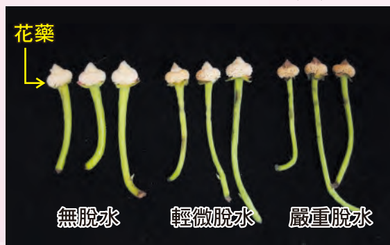
圖1. 番荔枝花藥(粉)脫水與褐化之外觀型態。