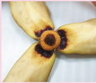
圖4. 花朵堆疊悶熟而褐化之花藥外觀

時，花瓣則幾乎喪失保護功能。因此採後處理時，務必注意相對濕度變化，以免花粉品質大受影響。