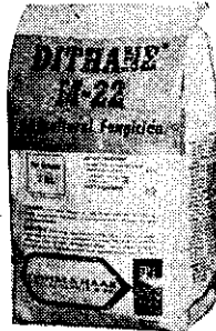
大生二十二可濕性粉劑

病斑增大至二公分以上,呈棕色。病斑漸行合併,嚴重時短期內整個葉片枯死。本病在臺灣有發生紀錄,惟一向認為輕微,比較中南美洲對本病觀念,則臺灣之高雄區,應視本病已屬嚴重程度。 病原菌須在潮濕或有雨水環境中生長。南美各香蕉生產國家在潮濕期或雨季開始後每隔十四天噴大生二十二一次防治香蕉葉斑病的發生。每次每甲噴大生二十二四百倍稀釋液一千一百二十五公升。合每次每甲噴大生二十二25磅。乾燥期每月仍需噴大生二十二一次防治葉斑病的侵害。香蕉葉面含有大量臘質,且需在潮濕環境中噴藥,在每四公升大生二十二稀釋液中須加出來通一一四農藥展着劑一CC(本公司備有該展着劑)以增加大生之藥效。