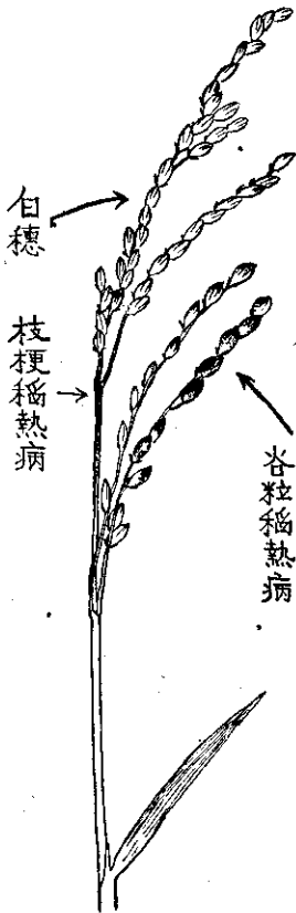
出穗後容易感染熱病的病蟲

水稻螟蟲 應根據預測燈的螟蛾誘殺數量，和田間螟蟲的發生情形，測定幼蟲初期，施用「安特靈」五百倍，四十七%「巴拉松」或四十五%「依必安」，或五十%「速滅松」等乳劑一千倍液，每公頃一千二百至一千五百公升。孕穗期和齊穗期也