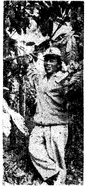
友農捷報邱的功成可可植試

日人當初引進的「可可樹」品種很多，目前邱農友試種的，除了「ホラステロ」和「クネオロ」二品種外，還有多種雜交品種。邱農友認為，如果要普遍推廣，品種的純化，是很重要的的一個工作。