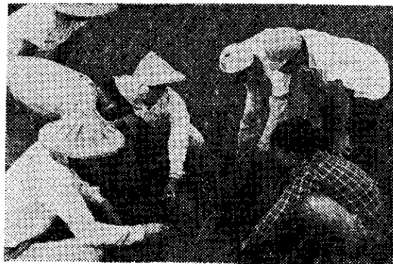
度驗酸壤土定測員會稻水鎮山關東臺

關山鎮各里水稻作業組會員，於上(五)月中旬紛紛舉行作業觀摩，觀察彼此水稻栽培管理技術，以增進水稻作業智能，指導員與義務指導員均參加，在田間為會員解答病蟲害問題，並用土壤檢定器檢查每位會員作業田土壤酸鹼度之反應，以做改良土壤和施肥參考。(利)