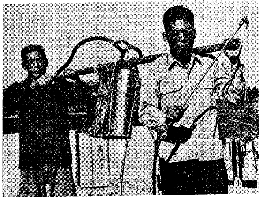
樂噴人二友農極宗簡