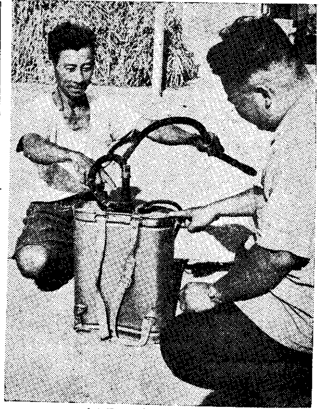
處水漏器噴指手友農力萬李