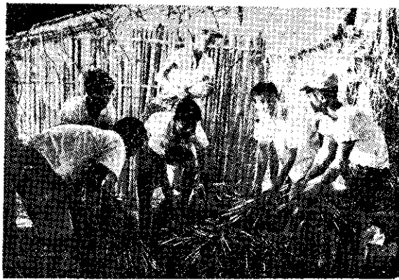
松清陳員會投南 六到甲學種草菇 (右第二人)

松會員，到六甲鄉龜港村甘藷組黃炳南會員家裡實習，六甲鄉四健會特安排其參加草菇共同作業栽培造床工作。(昆)