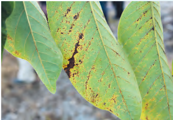
圖1. 臺東地區發生之鳳梨釋迦銹病葉背病徵