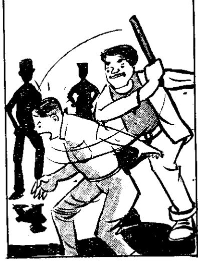
受阿 有再 交外 以名 男久 朋顧 友名 柳手