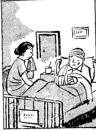
乾阿 採此 打母 真病 寬無 枉塊 講用