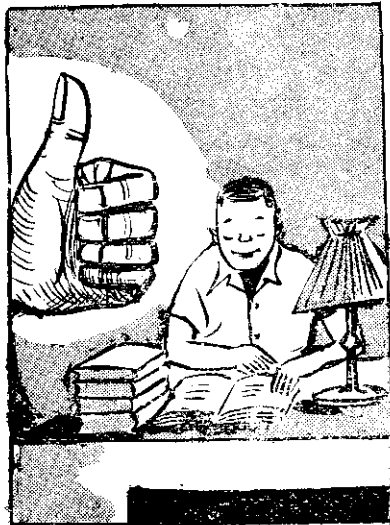
家農 勤為 耕人 為書 為讀 年女 老反 實失 職安 貴損

本刊最近收到很多讀者來信，詢問此事。我們除了商請糧食局加工趕印，使我們能早日發出外，因來信太多，我們未能一一回覆，敬請原諒！