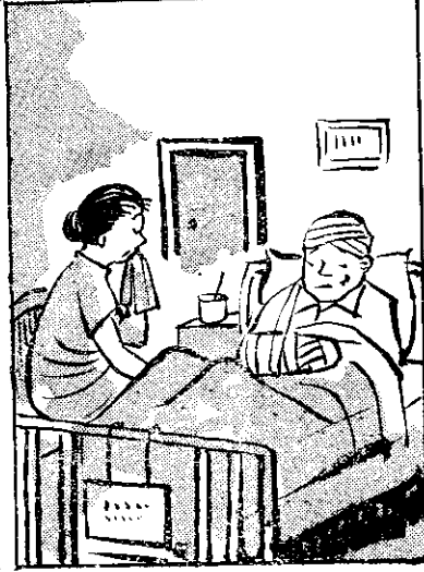
乾阿 誠自 打探 真病 冤橫 枉無 講塊 功用