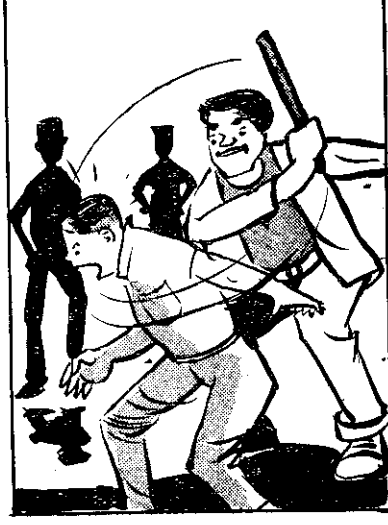
受阿 交外 男以 朋久 友名 柳阿 手打