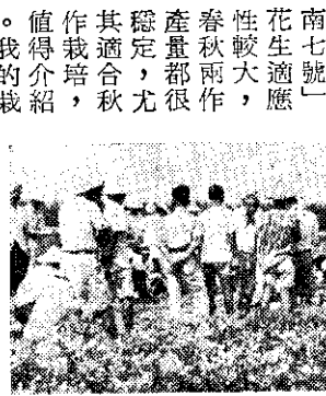
會厚觀生花號七南臺

我在今年三月三日，播種採種圃○·五公頃，到六月廿九日舉行成果觀摩會，由臺南縣政府和鄉農會指導人員會同，當場施行「坪刈」結果，換算一分地生莢產量達一千六百八十斤。